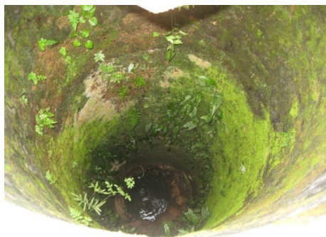
Giếng nước hiện đang sử dụng