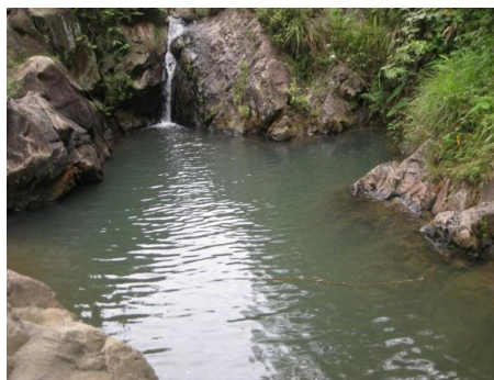
Nguồn nước trong núi