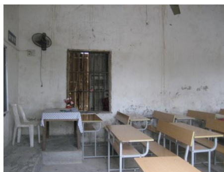
Các phòng học đã xuống cấp hiện đang sử dụng