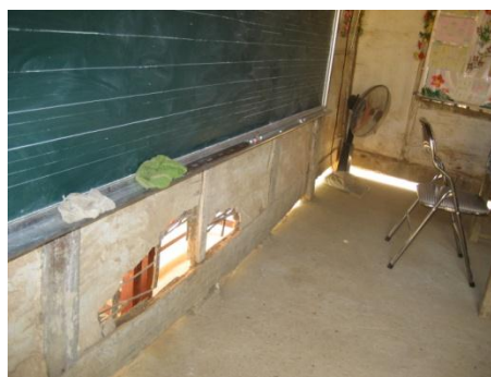
Các phòng học đã xuống cấp hiện đang sử dụng