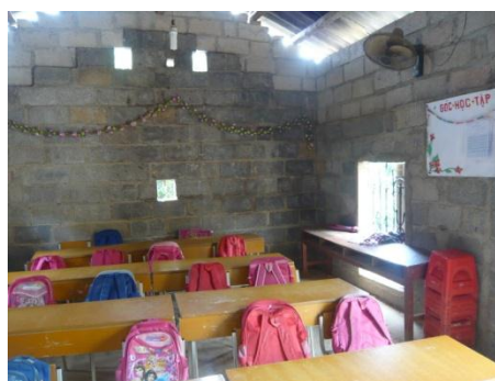
Phòng học tạm hiện đang sử dụng