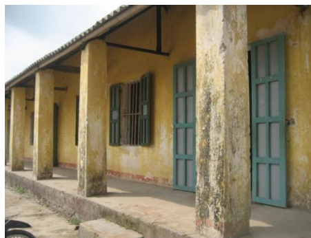
Các phòng học đã xuống cấp hiện đang sử dụng